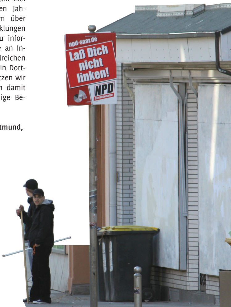
Zwei bewaffnete Neonazis haben sich vorm „Nationalen Zentrum“ postiert.

Antifaschistische Union Dortmund, Januar 2011