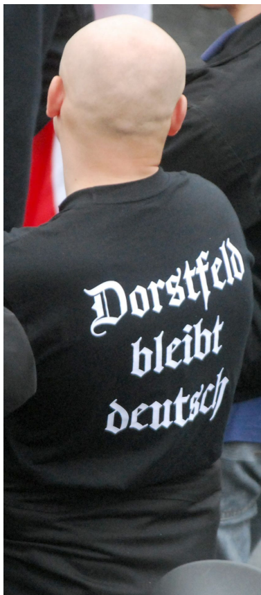
'Dorstfeld bleibt deutsch' Dumpfe Parolen kennzeichnen die T-Shirts der „Kameradschaft“

terschiedlicher Gruppenstärke besuchen die Neonazi-Skins regelmäßig öffentliche Versammlungen der extremen Rechten, sind dort aber auch nicht tiefergehend in