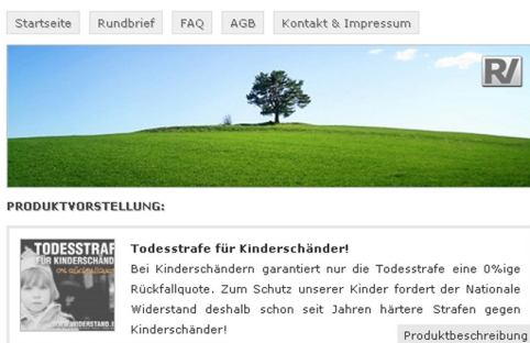
„Todesstrafe für Kinderschänder“: Screenshot vom Resistore-Vertrieb