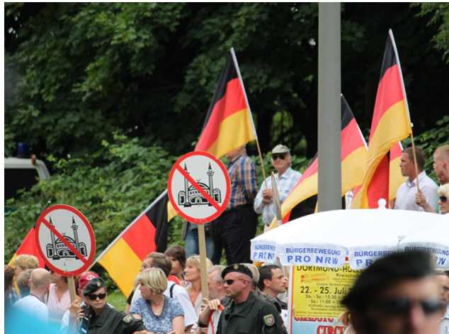
pro NRW-Kundgebung im Juli 2010 in Dortmund - Hörde