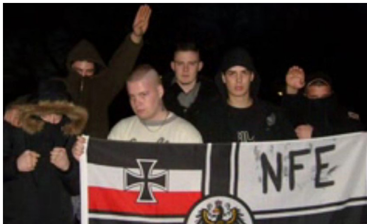
NFE-Mitglieder mit Hitlergruß und Reichskriegsflagge

am 30.05.2008 die Polizei, nachdem eine offensichtlich rechtsgerichtete 20-30-köpfige Personengruppe in Dortmund-Brechten lauthals rechte Parolen skandiert hatte. Die Polizei konnte allerdings nur noch zwölf männliche Personen im Alter von 16-23 Jahren aufgreifen, von denen der überwiegende Teil bereits einschlägig polizeilich erfasst war. Danach wurde es immer stiller um die Gruppe. Es tauchten zwar noch vereinzelt Schmierereien mit dem Gruppen-Kürzel in Verbindung mit neonazistischen Sprüchen und Symbolen auf, doch eigenständige Aktivitäten waren nicht mehr wahrnehmbar. Schließlich wurde die eigene Homepage vom Netz genommen und die Gruppe löste sich dann stillschweigend im Jahr 2009 de facto auf.