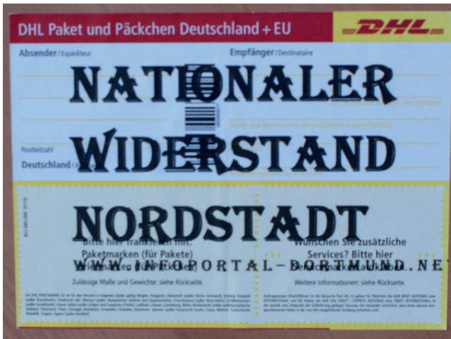
Höchst professionell und trotzdem nie öffentlich aufgetreten: Der „Nationale Widerstand Nordstadt“

Brackel, Wickede, Jungferntal und Berghofen entsprechende Cliquen, die nicht selten von einer breiten Ignoranz bis hin zur wohlwollenden Akzeptanz in dem jeweiligen Vorort profitieren können. Zwischenzeitlich gab es auch Gruppierungen, die versuchten, ein höheres und eigenständiges Aktions- und Organisationskonzept zu entwickeln, meistens aber an mangelnder Kompetenz scheiterten. Zu nennen wären hier zum Beispiel die Aktionsgruppe Kirchlinde oder der Nationale Widerstand Nordstadt . Im Folgenden geben wir deshalb einen kleinen Überblick über die aktuell bestehenden Gruppen des militanten Neonazismus in Dortmund.