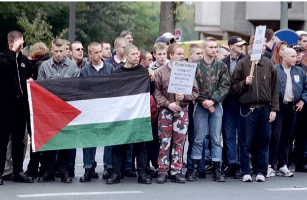
Naziaufmarsch im Oktober 2000 in Dortmund: Damals noch ohne „Autonome NationalistInnen“

Die Dortmunder Neonaziszene in ihrer heutigen Ausprägung kann zum Teil auf eine jahrzehntelange Tradition zurückblicken. Im Laufe der Jahre haben die Dortmunder Neonazis mehrere "Kameradschaften" hervorgebracht und verschiedene Strukturen, Bewegungen und Konzepte erprobt, die heute kennzeichnend für den "Pluralismus" und das breite Organisationsspektrum der hiesigen Neonaziszene sind. Eine dauerhafte Konstante war dabei aber immer ihre Gewaltbereitschaft, die in Dortmund gleich mehrere Todesopfer forderte.